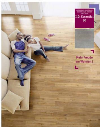
Broschüre Essetial ID 30

Tarkett THE ULTIMATE FLOORING EXPERIENCE