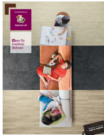
Broschüre Selection ID 40

Tarkett THE ULTIMATE FLOORING EXPERIENCE