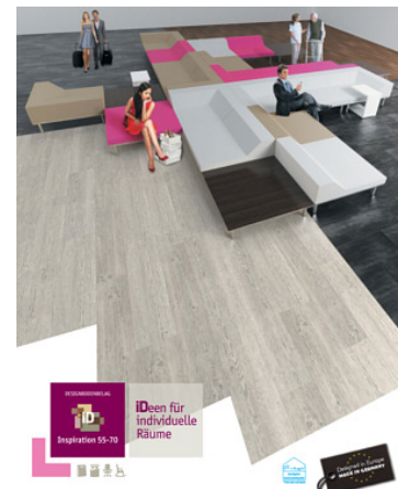
Broschüre Inspiration ID 55-70

Tarkett THE ULTIMATE FLOORING EXPERIENCE